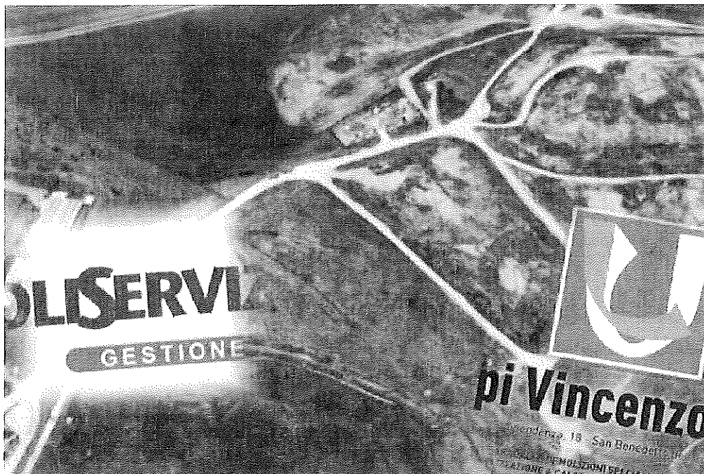
La discarica di Relluce, Ascoli Servizi Comunali e Lupi Vincenzo Srl

Un bando di gara con base dei lavori per quasi 900 mila euro vinto, tra 315 manifestazioni di interesse, da una ditta beneventana con un ribasso di quasi il 30%. Poi Ascoli Servizi chiede un parere motivato e complesso per l'esimente dagli appalti e sceglie la trattativa privata: spesa di 370 mila euro più 45 mila pagati all'azienda prima vincente per evitare ricorsi